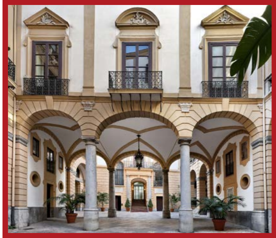
Palazzo Comitini visite guidate gratuite / free guided visits