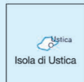
Isola di Ustica