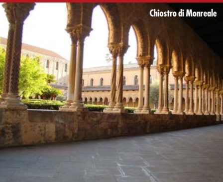
Chiostru di Monreale