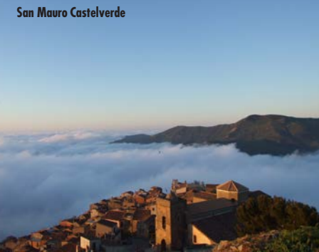
San Mauro Castelverde