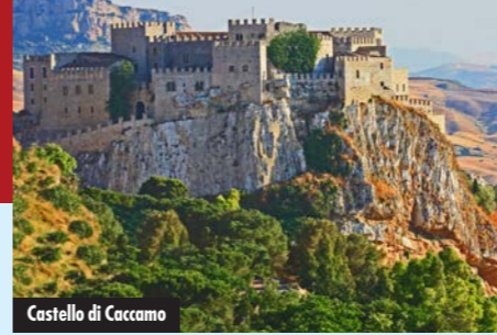
Castello di Caccamo