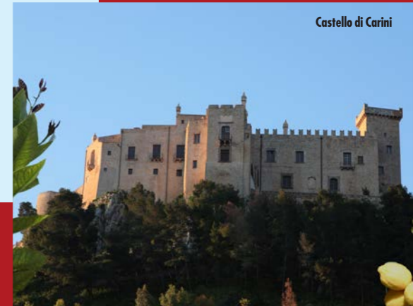
Castello di Carini

“Un viaggio attraverso la Sicilia è un viaggio che dura tutta la vita”.